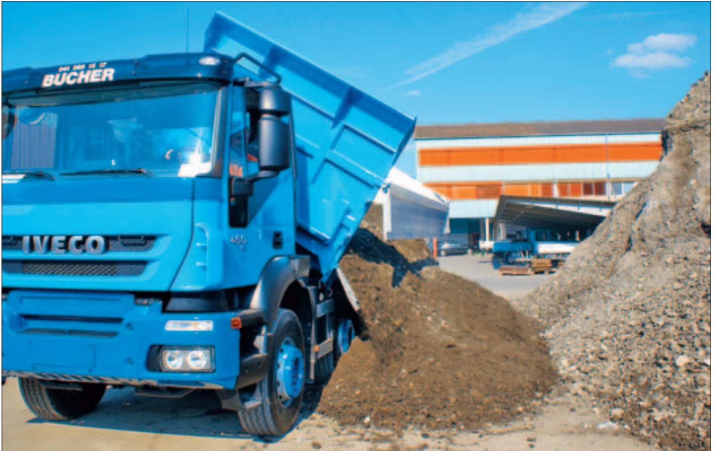
3-Seiten-Kippbrücke auf 4- oder 5-Achs-LKW