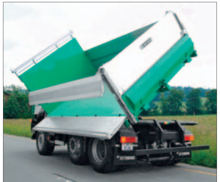
Seitenladen längsgeteilt; Oberteil pendelnd, Unterteil auf Auszugstützen aufliegend