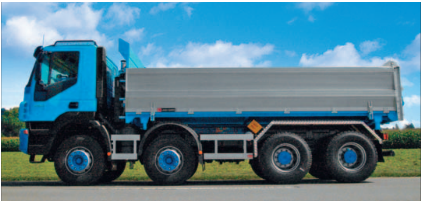
L+M-Matic Seitenladen längsgeteilt; Oberteil pendelnd, Unterteil hydraulisch abklappbar