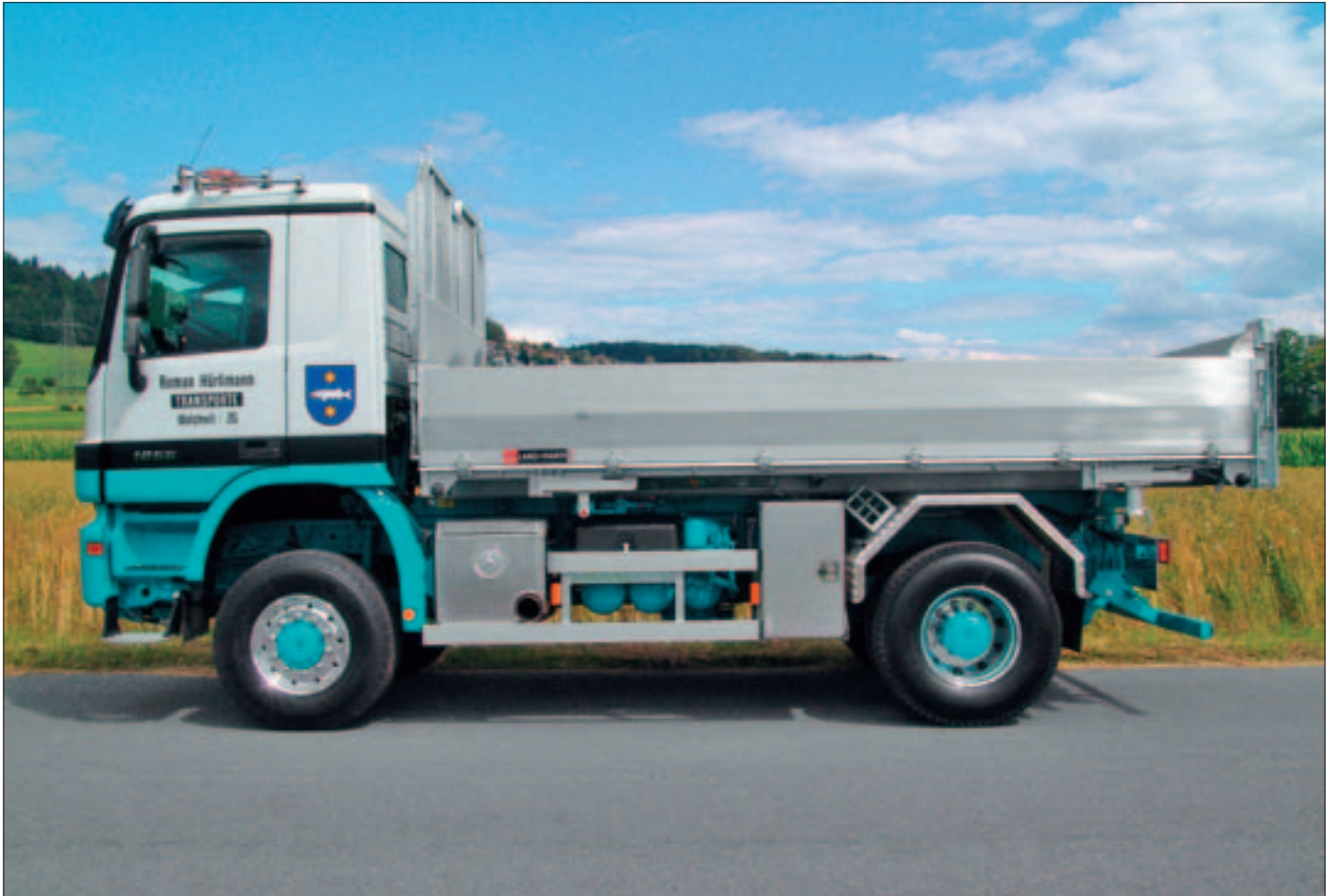
3-Seiten-Kippbrücke auf 2-Achs-LKW mit Paletten-Innenbreite und für Heckkran auf Konsolen