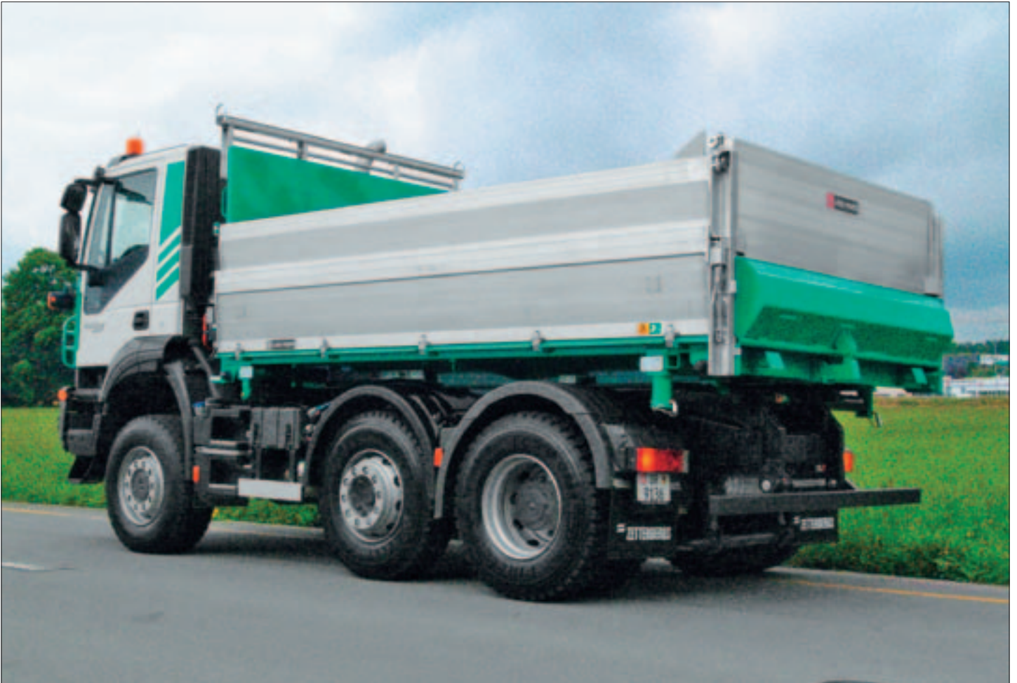
3-Seiten-Kippbrücke auf 3-Achs-LKW mit einem einfachen Wechselsystem in Verbindung mit einer Sattelkupplung