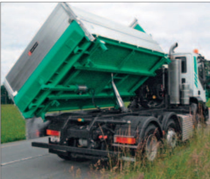
Rückladenautomatik mit 400 mm hohem Aushubladen aus Stahl, HARDOX HB 450