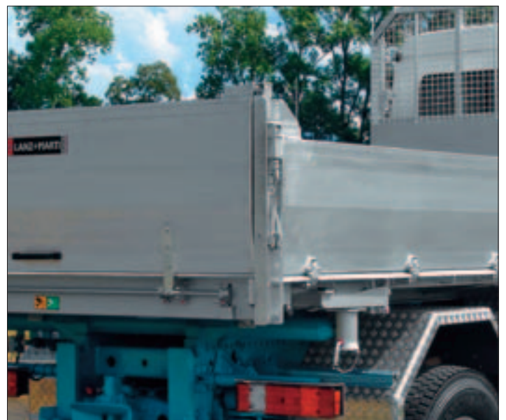
Eckpfosten hinten mit Stangenverschluss, demontierbar Seitenladenauflage ausklappbar