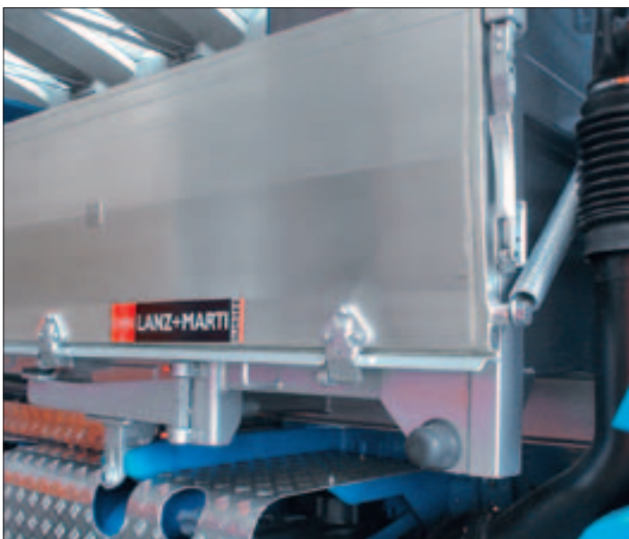
Seitenladen aus doppelwandigen Spezial-Aluminium-Profilen, abklappbar, mit Federhilfe an Stirnwand